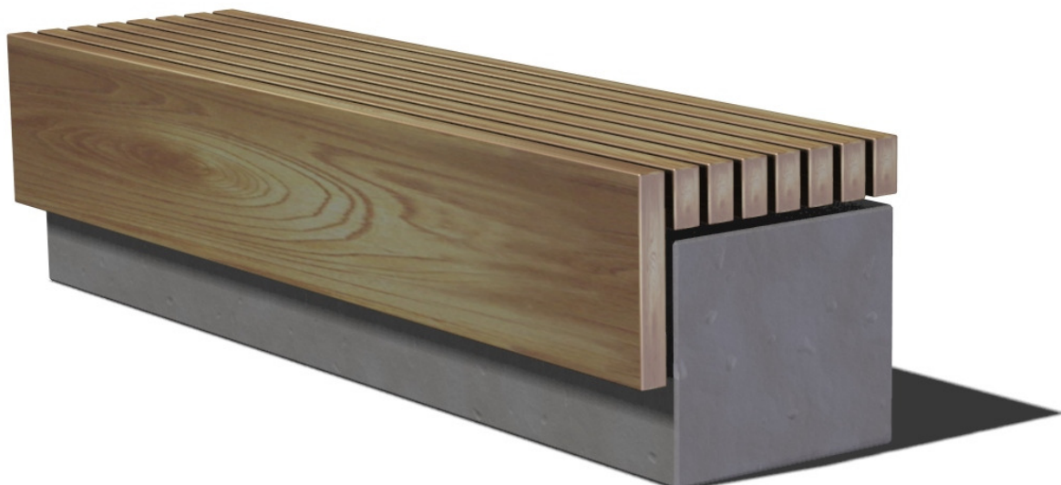
Ławka nr 13-02-46_01, prod. "Puczyński"