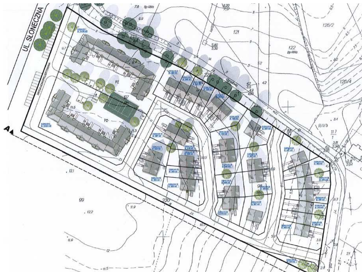
Lokalizacja na mapie miejscowości