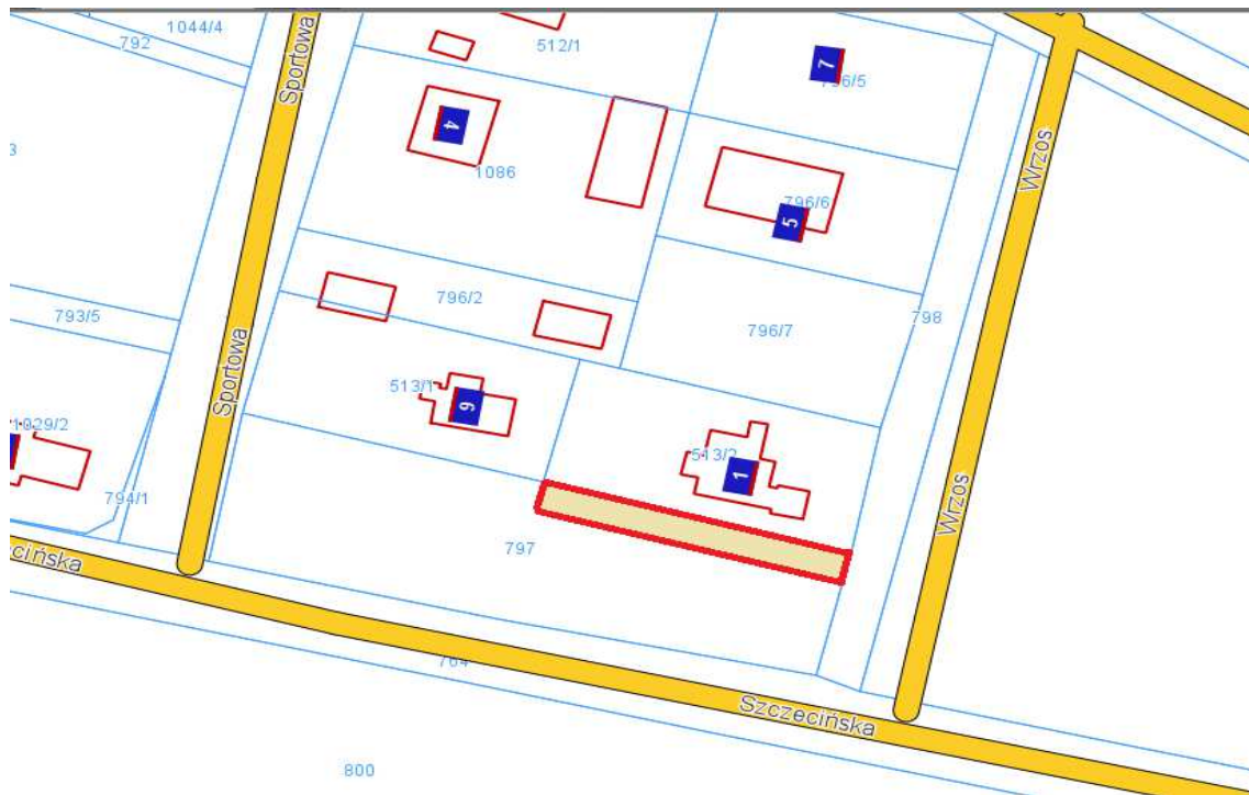
Wyrys z planu zagospodarowania przestrzennego