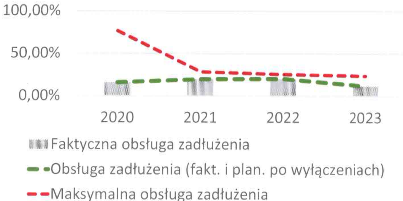
Rysunek 1. Kształtowanie się relacji z art. 243 uofp

Zgodnie z art. 243 ust. 1 ustawy z dnia 27 sierpnia 2009 r. o finansach publicznych (tj. Dz. U. z 2019 r. poz. 869 ze zm.) od 1 stycznia 2014 r. obowiązuje indywidualny wskaźnik zadłużenia dla samorządów, który uległ modyfikacji z początkiem roku budżetowego 2020, a następnie zmieniony został przepisami związanymi z przeciwdziałaniem COVID-19.