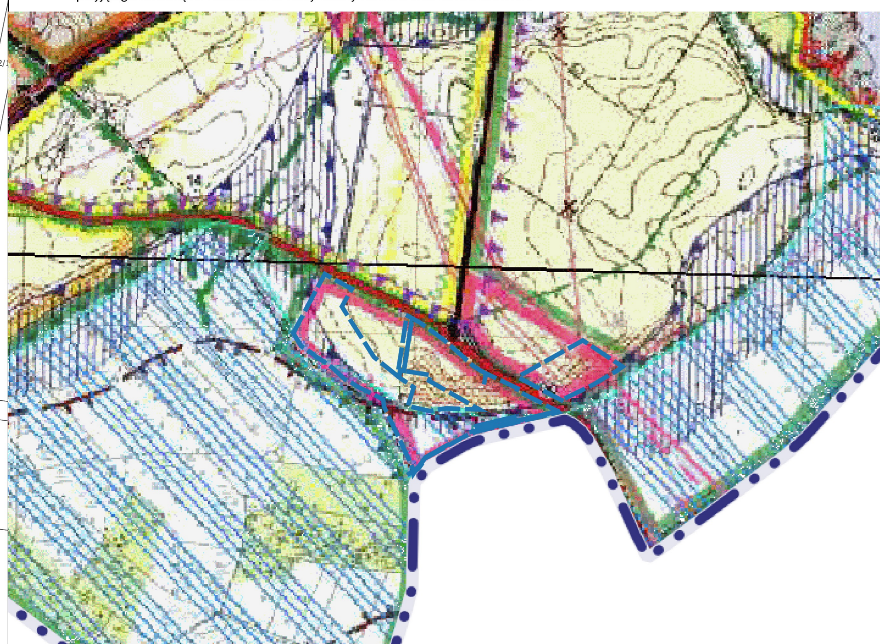
Granice obszaru objętego planem