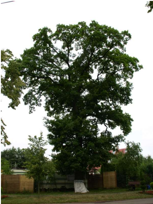
Fot. 1. Pokrój drzewa od strony południowej