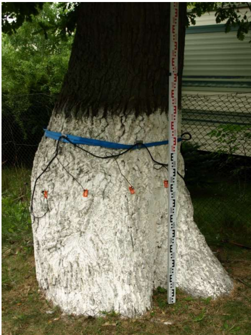
Fot. 3. Część odziomkowa pnia drzewa, zamontowane czujniki Picus na wys. 0,7 m n.p.g