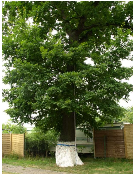
Fot. 2. Pień drzewa oraz podstawa korony z rozwidleniami I-rzędu