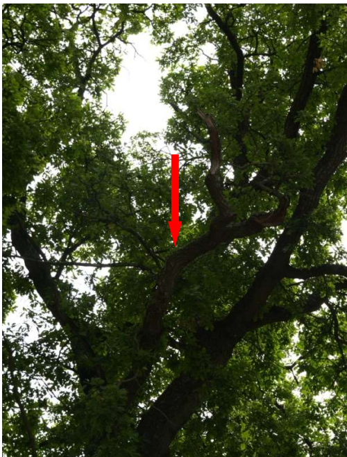
Fot. 7. Posusz konarowy w koronie drzewa