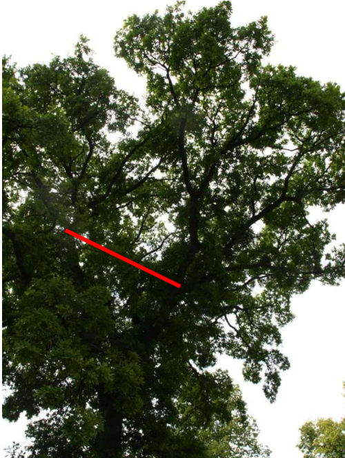
Fot. 5. Korona drzewa od strony wschodniej. Czerwoną linią oznaczono miejsce montażu wiązania cobra Plus 4t

DĄB SZYPUŁKOWY ( QUERCUS ROBUR L.) W ŚLIWINIE PRZY UL. LIPOWEJ (DZ. NR EWID. 233) ORAZ LIPA SZEROKOLISTNA ( TILIA PLATYPHYLLOS SCOP.) W REWALU PRZY UL. SAPERSKIEJ (DZ. NR EWID. 399/3)