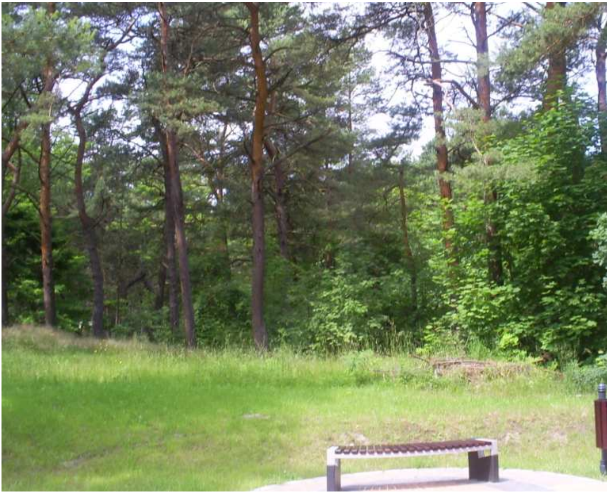
Widok na działkę z ul. Bursztynowej