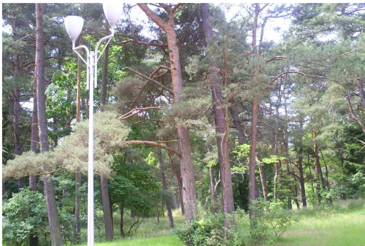
Widok na działkę z ul. Bursztynowej