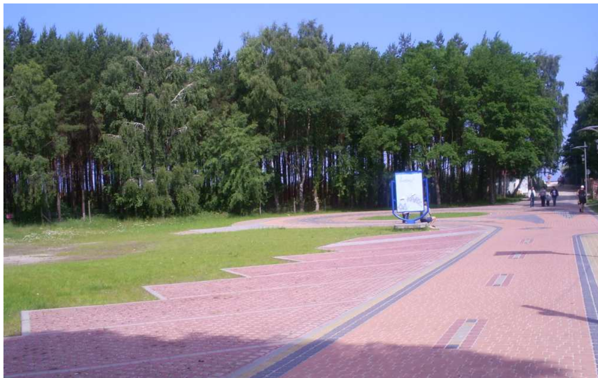
ul. Leśna – zejście na plażę