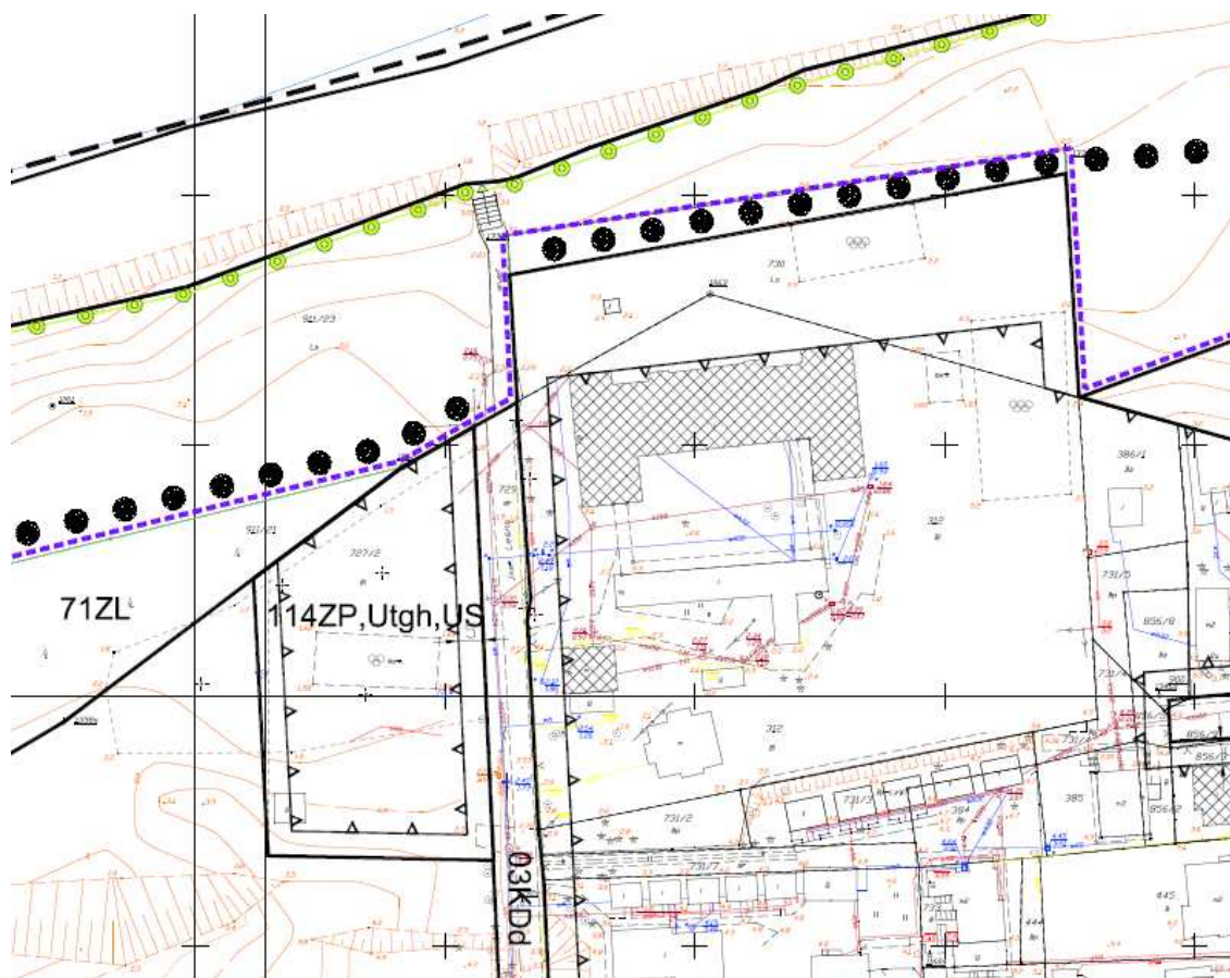
Wypis z planu zagospodarowania przestrzennego przyjętego uchwałą NR LXIII/437/10 RADY GMINY REWAL z dnia 29 września 2010 r.