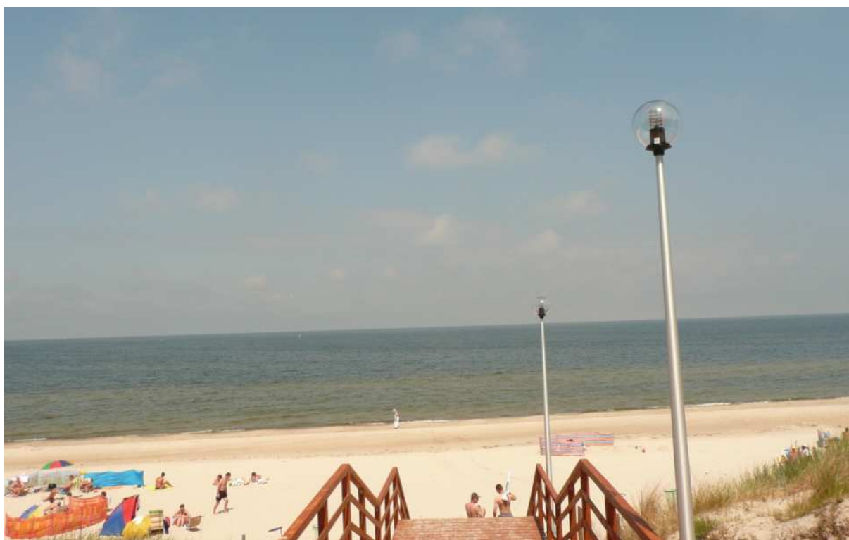
działka 304/12 o pow. 5487 m 2 obr. Pogorzelica