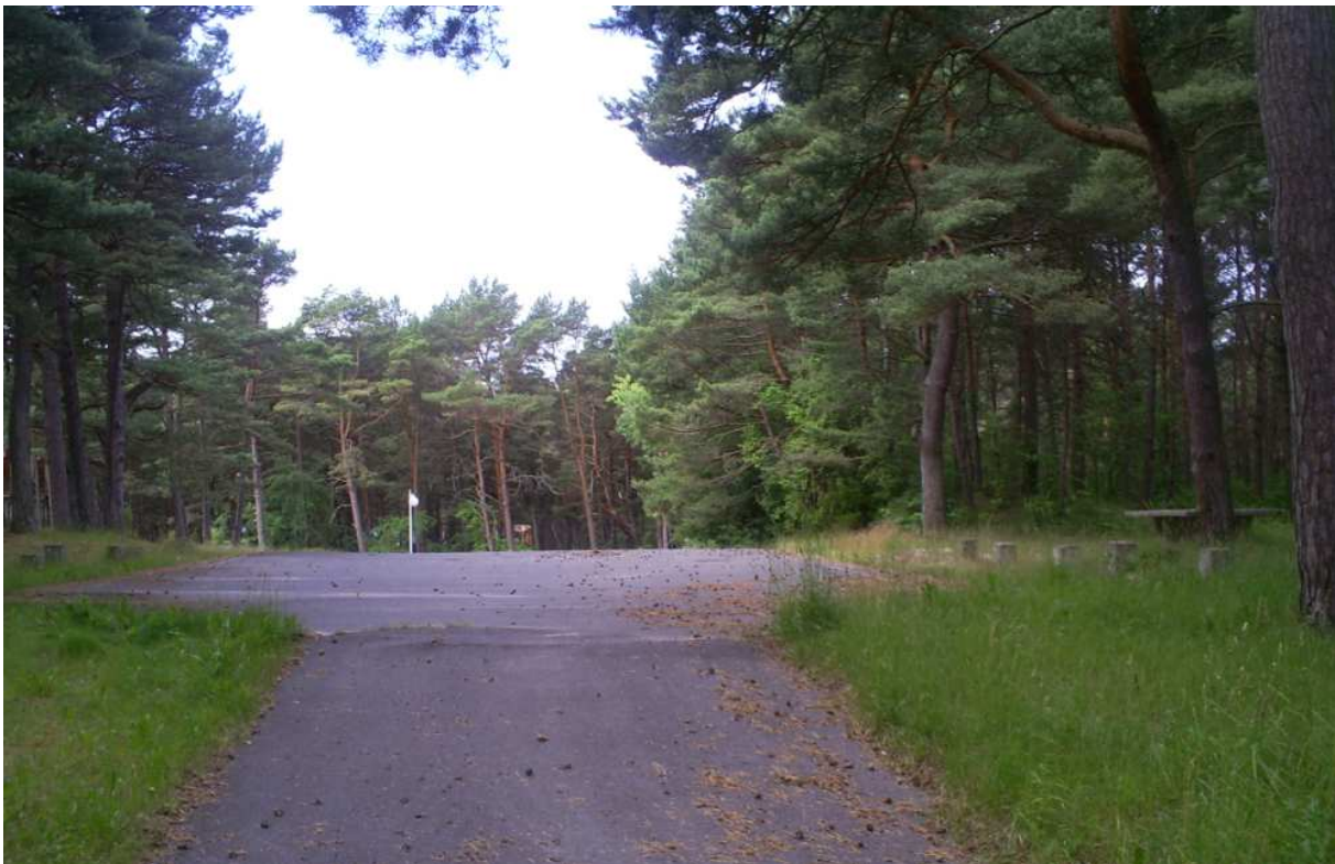
Widok na plac, z prawej strony ( południe) wjazd na działkę nr 304/12 z lewej strony ( północ) wjazd na działkę nr 304/6