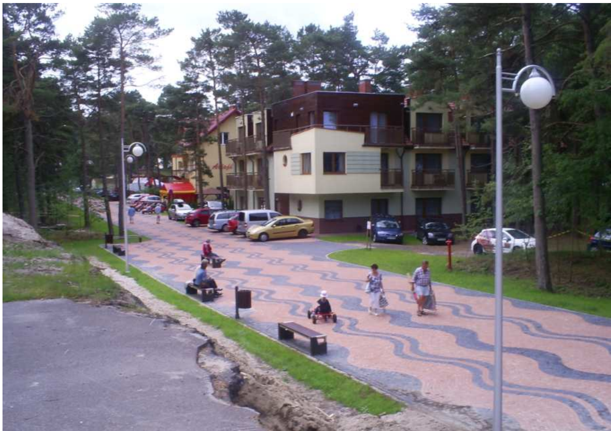
Widok z placu na ulicę Szstormową – zejście na plażę