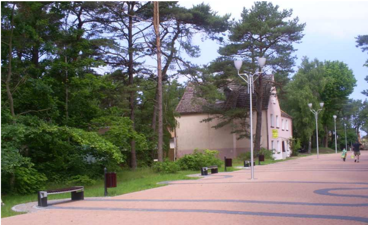
Widok na działkę z ul. Bursztynowej – zejście na plażę