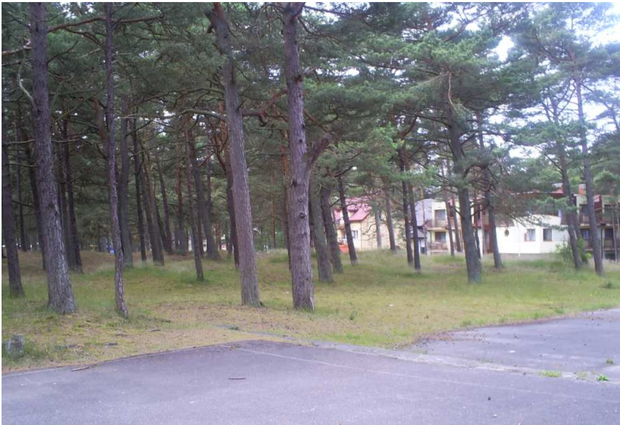
Widok na działkę z placu w kierunku ul. Sztormowej