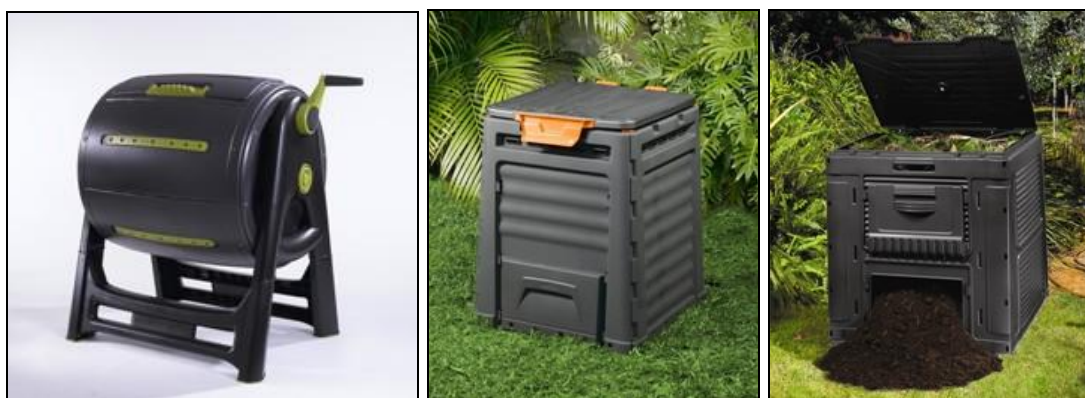
Ryc. 7: Przydomowe kompostowniki

Można też stosować gotowe, estetyczne kompostowniki, które dostępne są w ofertach firm produkujących pojemniki na odpady.