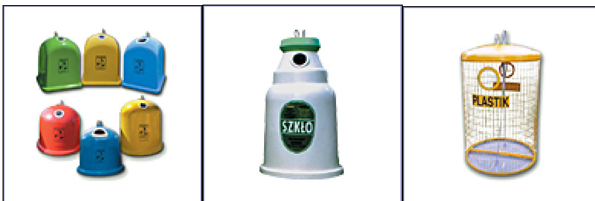
Ryc. 5: Przykładowe pojemniki do selektywnej zbiórki na zewnątrz