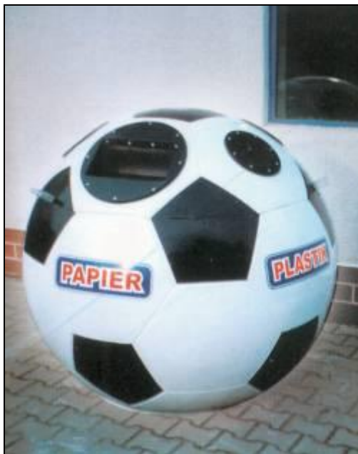
Ryc. 10: Przykład pojemnika do segregacji odpadów w szkołach

Pojemniki powinny zostać ustawione na koszt Gminy. Ich ustawienie powinno być poprzedzone akcją edukacyjną. Przykładowe pojemniki dla szkół przedstawiono poniżej.