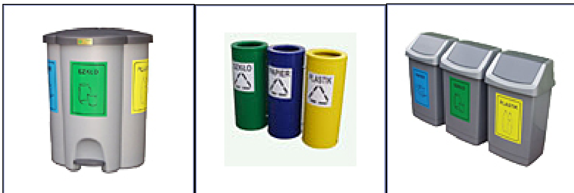
Ryc. 3: Przykładowe pojemniki do stosowania wewnątrz budynków