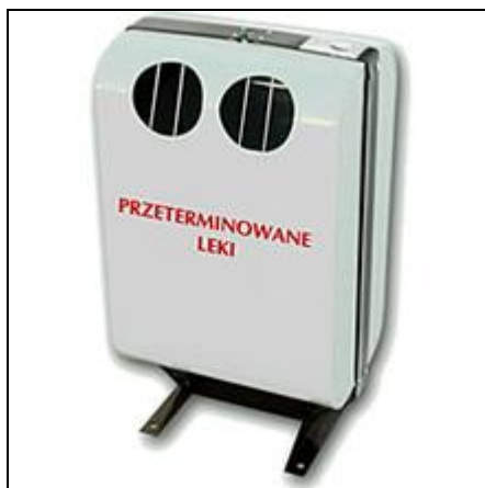
Ryc. 8. Pojemnik typu FOKA do zbiórki leków przeterminowanych (Abrys Technika)

Częstotliwość odbioru tych odpadów uzależniona będzie od tempa zapewniania się pojemników w poszczególnych punktach.