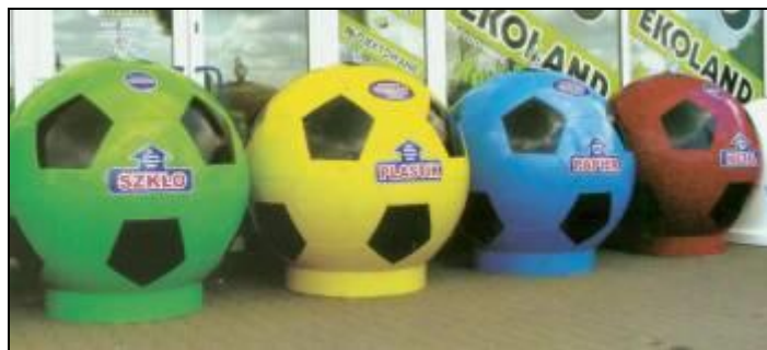
Ryc. 11: Pojemniki do segregacji odpadów w szkołach