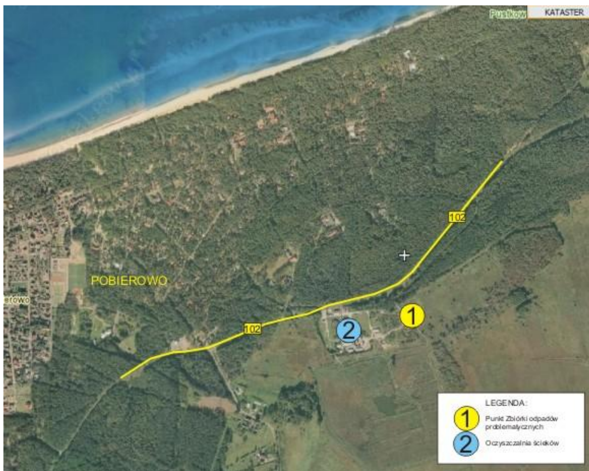
Ryc. 9: Proponowana lokalizacja Stacjonarnego Punktu Selektywnego Zbierania Odpadów w pobliżu istniejącej oczyszczalni ścieków

Proponowana lokalizacja punktu: miejscowość Pobierowo, obręb Pobierowo, na części działek: 910 (własność Gmina Rewal), 505/6 (PGL Lasy Państwowe - droga dojazdowa) oraz 505/7 (własność Gmina Rewal).