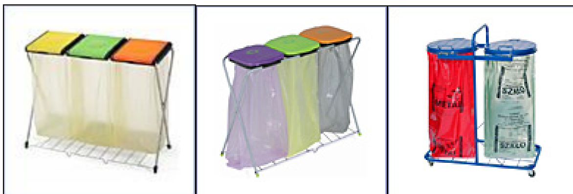
Ryc. 4: Przykładowe stojaki na worki do stosowania wewnątrz budynków