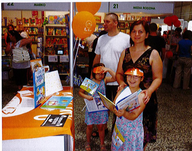
Targi zorganizowane przez Towarzystwo Promocji Ryb.

kie. Jednak najbardziej oczywistym rodzajem filmów, promujących rybackie produkty lub obszary objęte LSROR, są spoty reklamowe. Dzięki dużej oglądalności wykorzystanie spotów telewizyjnych i internetowych może być efektywnym narzędziem promocyjnym obszaru;