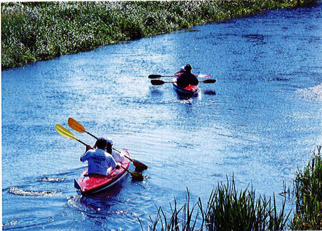
Środki pozyskane z Osi 4 PO RYBY 2007-2013 rybak może przeznaczyć na stworzenie zróżnicowanej oferty dla aktywnych turystów, m.in. zorganizowanie wypożyczalni kajaków lub rowerów.

Oś priorytetowa 4 PO RYBY 2007-2013 stwarza beneficjentom wiele możliwości podejmowania inicjatyw w celu poprawy własnego statusu społeczno-ekonomicznego.