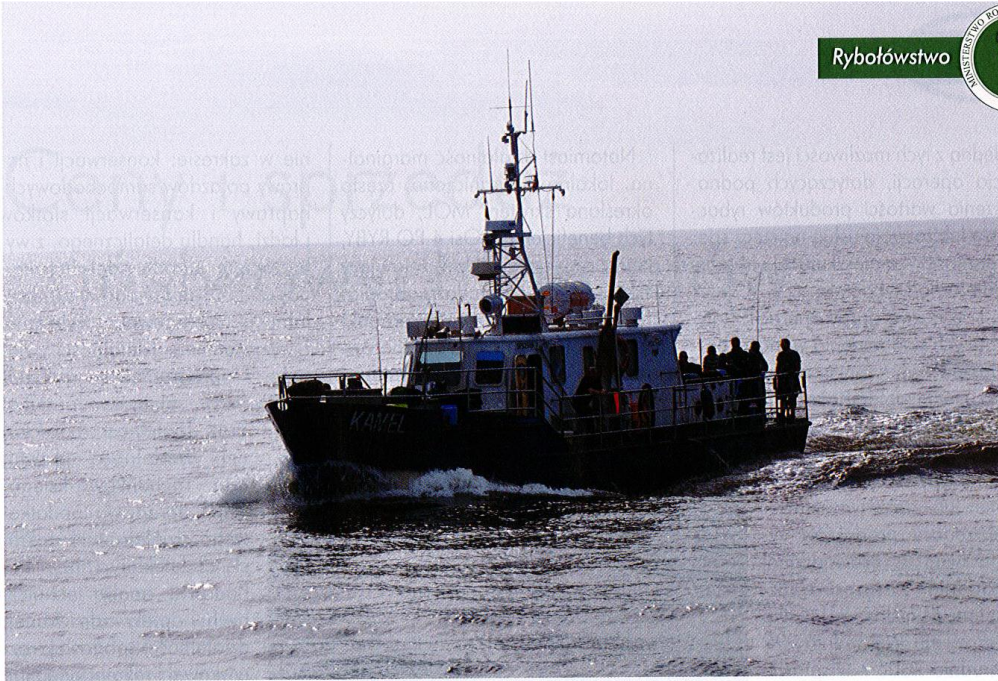
Dzięki możliwości uzyskania dofinansowania remontu i adaptacji statku rybackiego, jego właściciel może zaoferować turystom wyprawy po wędzarskie trofea lub rejs wycieczkowy.

warsztat albo zakup wyposażenia i niezbędnych narzędzi. Dla rybaków bardzo przywiązanych do zawodu, wykonywanego przez całe życie, rozwiązaniem może być natomiast stworzenie gospodarstwa wielofunkcyjnego. Wówczas obok dotychczasowego połowu albo chowu ryb, jego właściciel może założyć restaurację rybną, winiar-