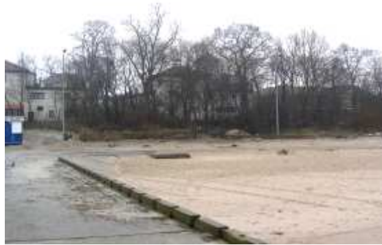
Miejsce lokalizacji promenady w Niechorzu.

Realizacja inwestycji przewiduje budowę promenady wzdłuż linii brzegowej morza od pirsu na wysokości ul. Parkowej do terenu przy Latarni Morskiej (koniec promenady - ul. Klifowa). Inwestycja obejmuje wykonanie nawierzchni wraz z oświetleniem. Zaplanowane jest również zagospodarowanie kompleksowe placu przy ul. Morskiej.