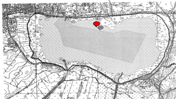
Lokalizacja (kolorem czerwonym) centrum windsurfingu przy jeziorze Liwia Łuża w Niechorzu.