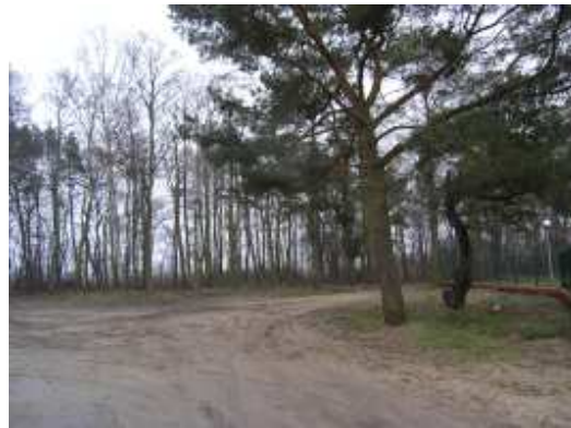
Miejsce lokalizacji centrum windsurfingu w Niechorzu.