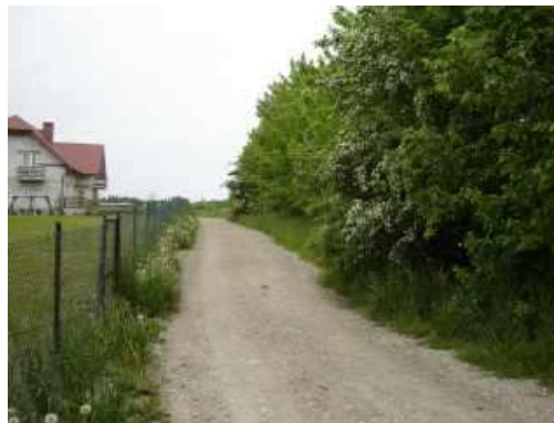
ul. Polna - aktualny stan techniczny.

Realizacja projektu przewiduje oświetlenie ul. Polnej w kierunku Latarni Morskiej oraz odcinka od ul. Polnej do zejścia na plażę przy Latarni Morskiej.