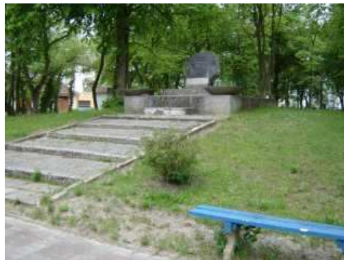
Pomnik przy ul. Parkowej – aktualny stan techniczny.

Przebudowa pomnika w parku przy ul. Parkowej, ma upamiętnić wyzwolenie Niechorza w dniu 12 marca 1945r. oraz ludzi, którzy nie wrócili z morza.