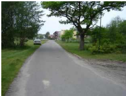
ul. Rybacka - aktualny stan techniczny.

Przebudowa chodnika na długości ok. 180 metrów z kostki betonowej typu "polbruk", przy ul. Rybackiej.