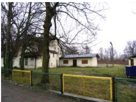
Miejsce lokalizacji remizy i centrum powiadamiania.

Przedmiotem inwestycji jest budowa budynku Centrum Ratownictwa i Remizy OSP. Na terenie objętym planowaną inwestycją znajdują się budynki gospodarcze, które z uwagi na kolizję z projektowanym budynkiem wymagają wyburzenia. W ramach inwestycji na terenie działki zostaną wykonane przyłącza i instalacje infrastruktury technicznej: wodociągowa, kanalizacji ściekowej, gazowa i do sieci elektroenergetycznej. Zaplanowano również poszerzenie wyjazdu od strony ulicy Kolejowej dla bezpośredniego dostępu wozów Ochotniczej Straży Pożarnej, zlokalizowanie miejsc