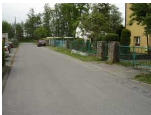
ul. Szczecińska - aktualny stan techniczny.

Budowa chodnika na długości ok. 120 mb z kostki betonowej typu "polbruk" po prawej stronie ul. Szczecińskiej w stronę ul. Rybackiej.