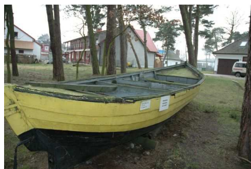
Muzeum Rybołówstwa w Niechorzu

Inwestycja ma na celu modernizację Muzeum Rybołówstwa Morskiego w Niechorzu. Zadanie obejmuje m.in. wykonanie wymiany pokrycia dachu, wymianę instalacji elektrycznej i p.poż, wykonanie podjazdu dla wózków oraz zakup sprzętu audio-video i gablot wystawienniczych.