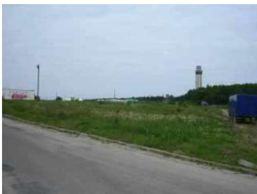
ul. Polna - aktualny stan techniczny.

Realizacja zadania przewiduje budowę chodnika wzdłuż ulicy Polnej po lewej stronie w kierunku Rewala.