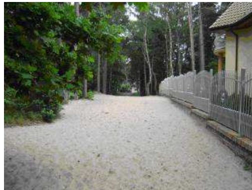
ul. Kawalerska – aktualny stan techniczny

Realizacja zadania przewiduje wykonanie ciągu pieszo-jezdnego na ul. Kawalerskiej od ul. Grunwaldzkiej - w kierunku morza - z kostki betonowej typu „polbruk” na odcinku ok. 250 mb wraz z oświetleniem.