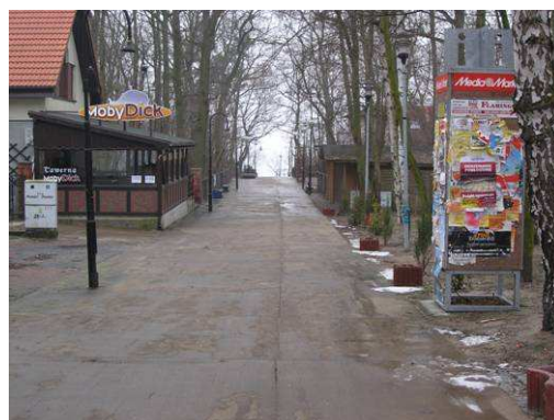
Dojście do plaży przy ulicy Mickiewicza w Pobierowie – aktualny stan techniczny.