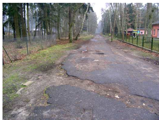
Ulica Zachodnia w Pobierowie – aktualny stan techniczny.