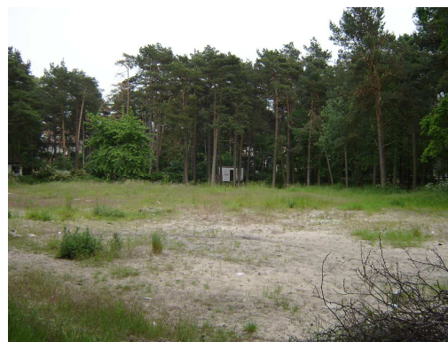
Miejsce inwestycji - teren przy skrzyżowaniu ul. Grunwaldzkiej i ul. Jana z Kolna.

Realizacja inwestycji przewiduje budowę na placu przy ulic Grunwaldzkiej i Jana z Kolna obiektów użyteczności publicznej, muszli koncertowej, placu zabaw, oświetlenia oraz umieszczenie obiektów małej architektury (ławki, kosze na śmieci).