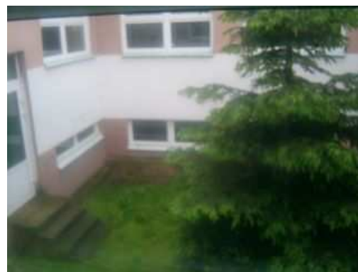
Atrium szkoły – aktualny stan techniczny

Realizacja inwestycji przewiduje przebudowę atrium znajdującego się na terenie szkoły w Pobierowie. W Pobierowie brakuje miejsca, które stałoby się centrum kulturalnym i ośrodkiem spotkań lokalnej społeczności.