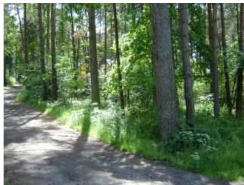
Miejsce inwestycji przy skrzyżowaniu: ul. Grunwaldzkiej i ul. Cichej

Realizacja przedsięwzięcia przewiduje utworzenie nowego placu zabaw w Pobierowie. Celem inwestycji jest stworzenie bezpiecznego obiektu do gier i zabaw dla dzieci.