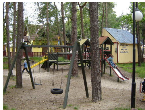
Plac zabaw przy ul. Grunwaldzkiej – aktualny stan techniczny

Realizacja zadania przewiduje modernizację i doposażenie placu zabaw przy ul. Grunwaldzkiej. Konsekwencją wdrożenia projektu będzie poprawa bezpieczeństwa dzieci podczas gier i zabaw.