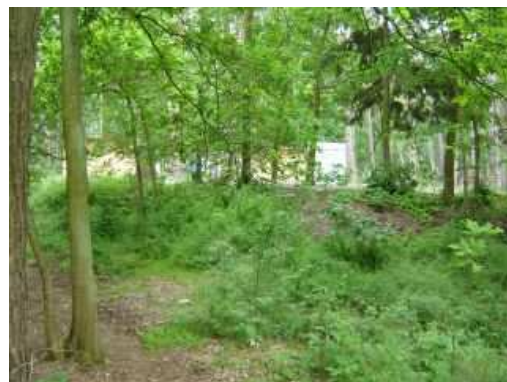
Miejsce inwestycji - teren przy ul. Grunwaldzkiej – aktualny stan techniczny

Realizacja zadania przewiduje budowę placu zabaw przy ul. Grunwaldzkiej. Konsekwencją wdrożenia projektu będzie poprawa bezpieczeństwa dzieci podczas gier i zabaw.