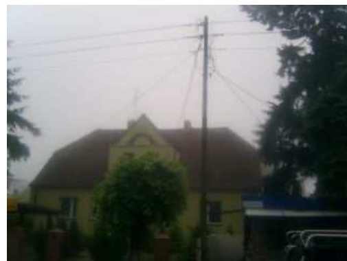
ul. Grunwaldzka – aktualny stan techniczny

Realizacja projektu przewiduje modernizację sieci energetycznej w centrum miejscowości tj. likwidację napowietrznych linii energetycznych (53 słupy) – przełożenie linii do ziemi.