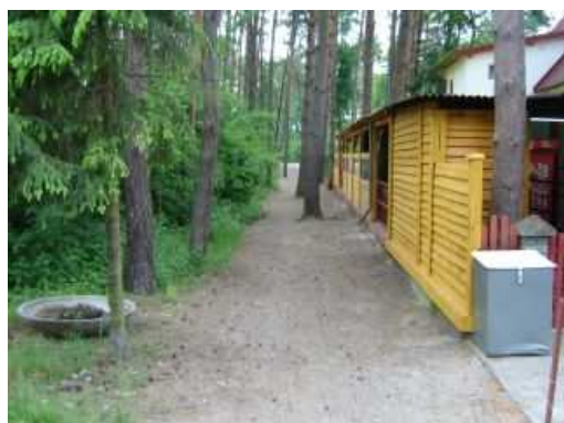
Miejsce inwestycji - widok z ul. Grunwaldzkiej