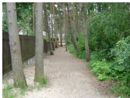
Miejsce inwestycji - widok z ul. Ciechanowskiej

Realizacja przedsięwzięcia przewiduje utworzenie łącznika dla ruchu pieszego pomiędzy ulicami: Grunwaldzka i Ciechanowska. Wykonanie zadania korzystnie wpłynie na wizerunek miejscowości, poprawi funkcjonalność ruchu pieszego, a także wpłynie na estetykę przestrzeni.