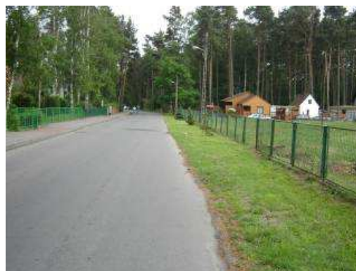
ul. Mickiewicza – aktualny stan techniczny.