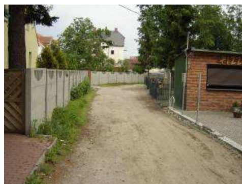
Ciąg pieszki pomiędzy ul. Zgody i ul. Grunwaldzką – aktualny stan techniczny.

Realizacja przedsięwzięcia przewiduje utworzenie łącznika - dla ruchu pieszego pomiędzy ulicami: Zgody i Grunwaldzkiej wraz z oświetleniem. Wykonanie zadania korzystnie wpłynie na wizerunek miejscowości, poprawi funkcjonalność ruchu pieszego, a także wpłynie na estetykę przestrzeni.