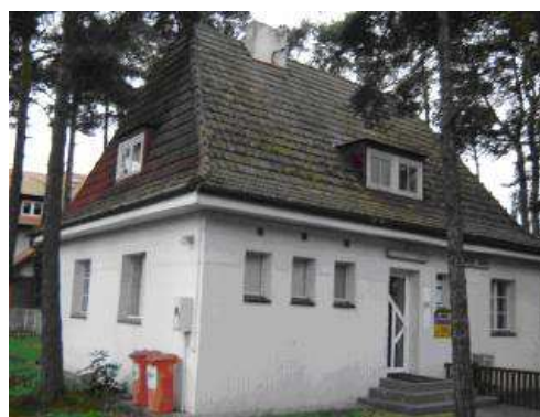
Ośrodek zdrowia przy ul. Grunwaldzkiej – aktualny stan techniczny.

Realizacja inwestycji przewiduje przebudowę i modernizację ośrodka zdrowia w Pobierowie. W wyniku wdrożenia inwestycji w ośrodku zdrowia powstanie laboratorium i dodatkowe gabinety lekarskie. Celem inwestycji jest także przystosowanie ośrodka dla osób niepełnosprawnych i przygotowanie go do spełnienia wymogów sanitarnych.